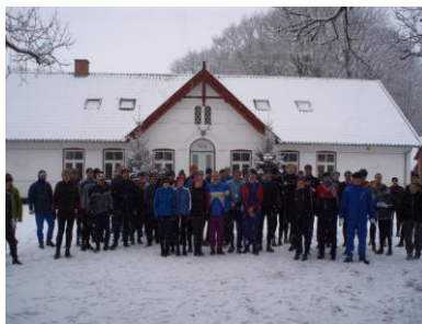
Vinterlang Feldborg 2009