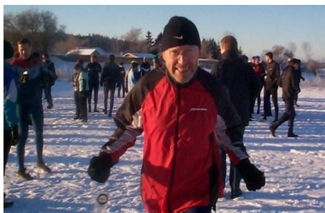
Vinterlang Silkeborg 2007